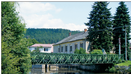
Provizorní železný most U Mandle v roce 2009

ČEZ, a.s., která je navíc připravena do akce vložit téměř 30 mil. Kč. Z finančního hlediska je však vybudování horkovodu a hlavně jeho budoucí provoz na samé hranici rentability. Proto se konec roku 2009 a začátek roku 2010 nesl ve znamení hledání optimální ceny za dodávané teplo, kterou jsou občané ještě ochotni zaplatit a která je pro ČEZ, a.s. ještě ekonomicky příja-